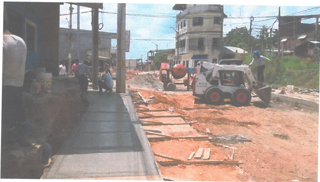
VISTA DE LA SUB BASE Y ACABADOS EN VEREDA