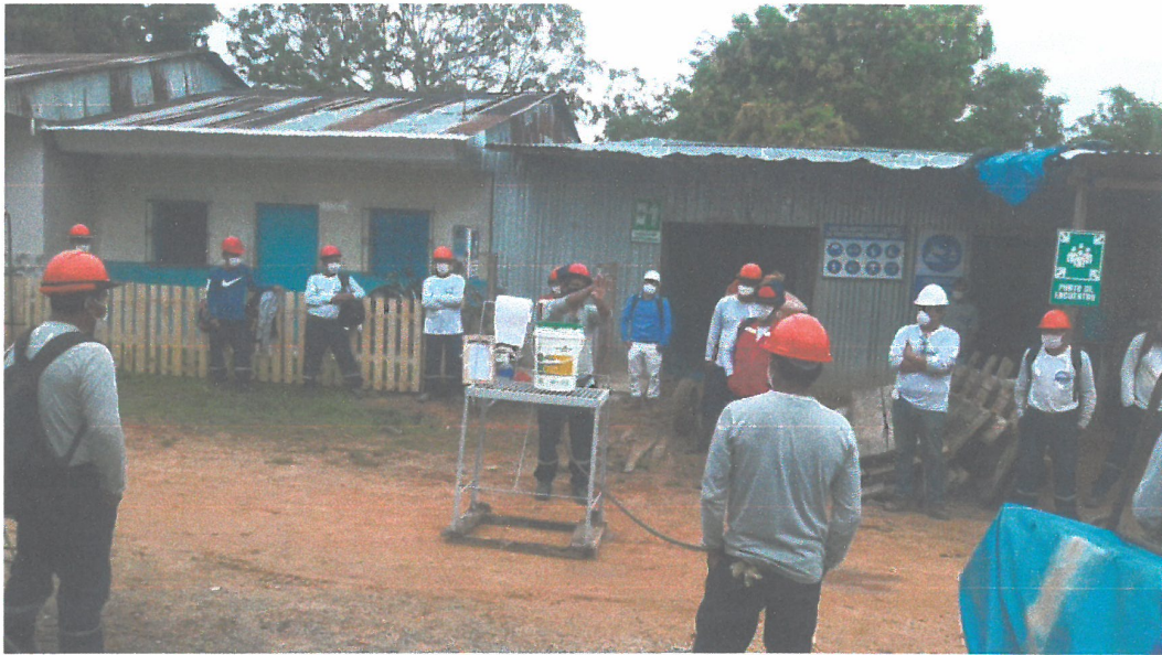
CHARLA DE SEGURIDAD Y HIGIENE DEL PLAN COVID19