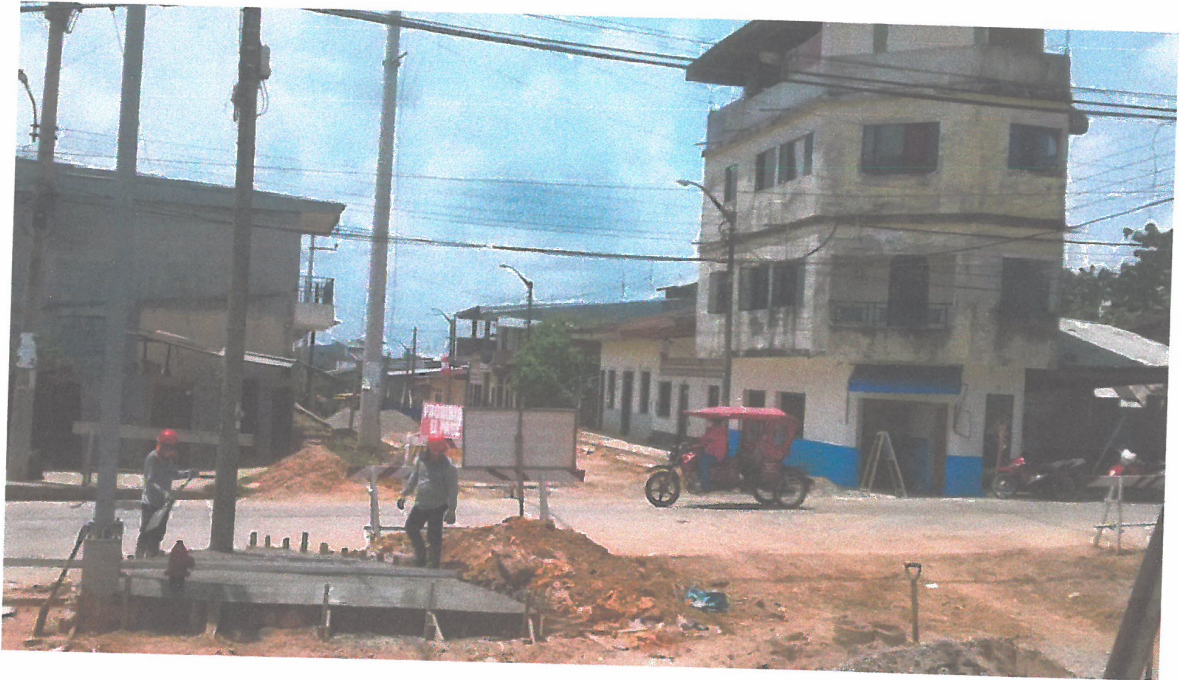
ACABADOS EN VEREDA