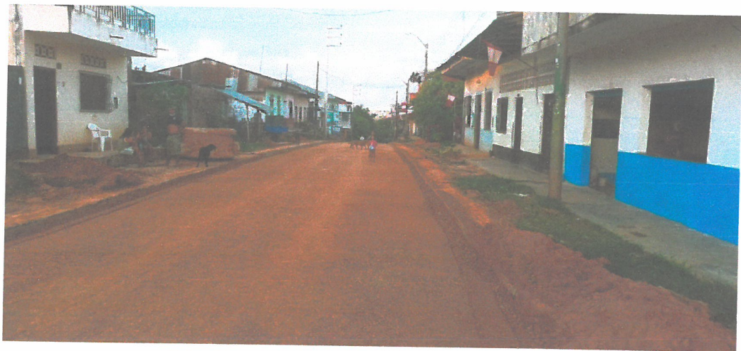
COLOCACION DE SUB-BASE