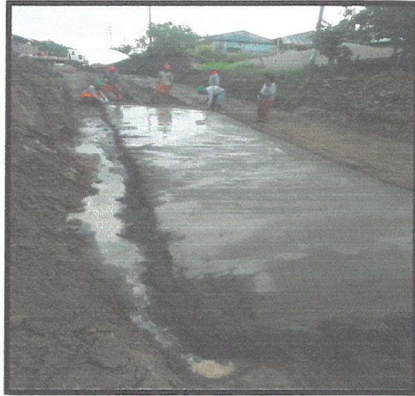
SOLADO 1:8 e=4", 0+260