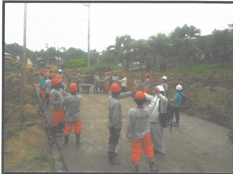
CHARLA DE SEGURIDAD Y PAUTAS ACTIVAS