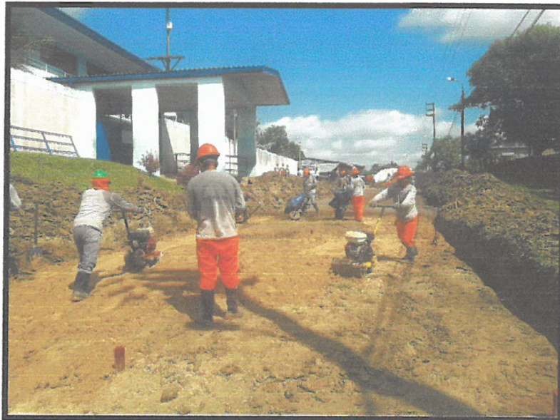
SUB RASANTE MEJORADA CON MATERIAL DE PRESTAMO 0+240

Construcción de Obras Públicas, Privadas y Alquiler de Maquinaria