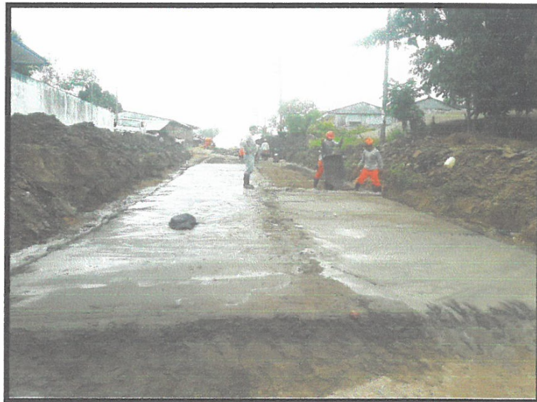
SOLADO 1:8 e=4", 0+280