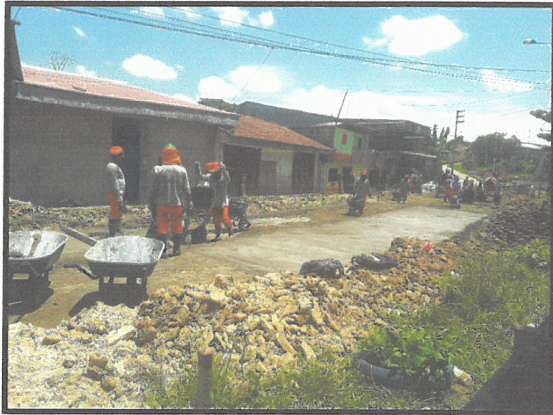
SOLADO 1:8 e=4", 0+240