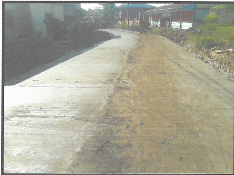
SOLADO 1:8 e=4", 0+220 - 0+340