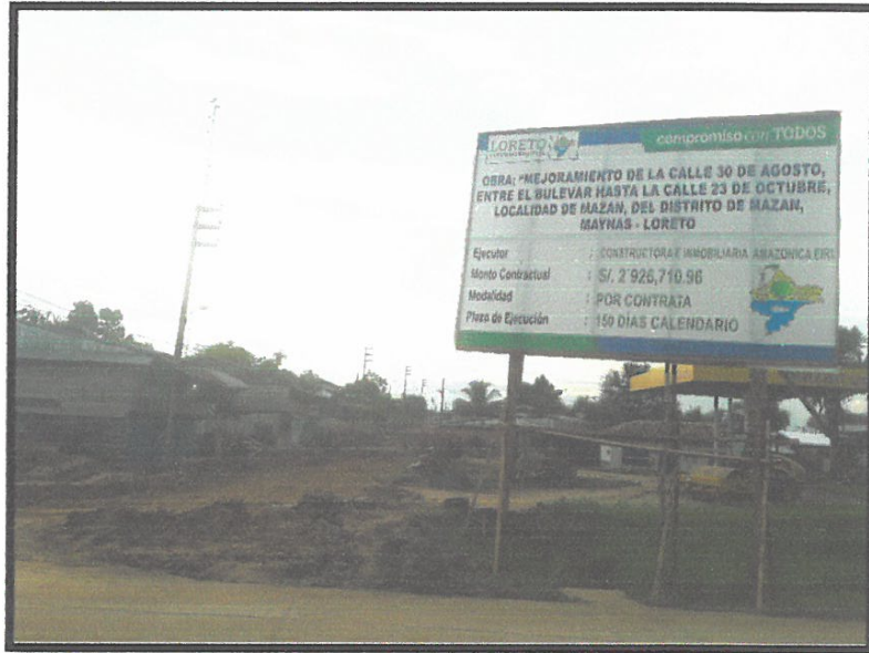
VISTA DEL CARTEL DE OBRA