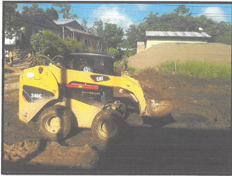
CONFORMACION DE TERRENO CON MAQUINARIA

Construcción de Obras Públicas, Privadas y Alquiler de Maquinaria