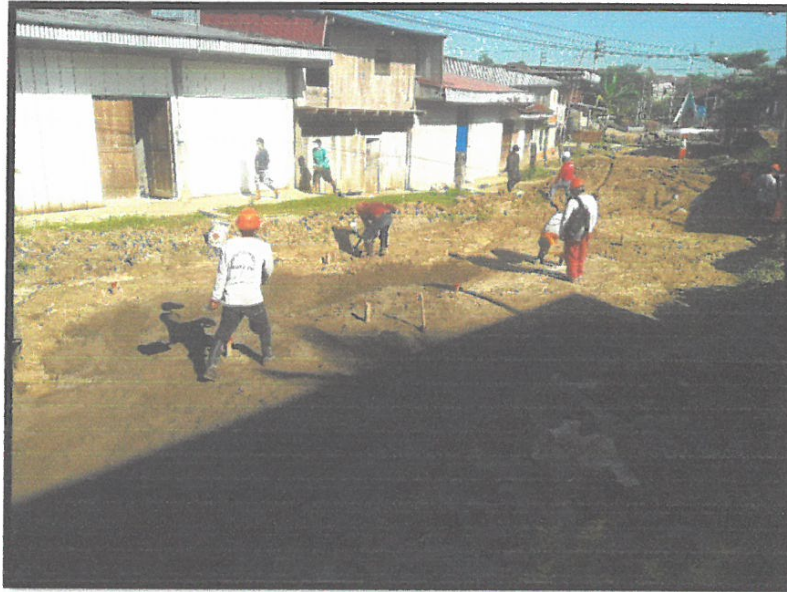
SUBRASANTE MEJORADA CON MATERIAL DE PRESTAMO 0+220