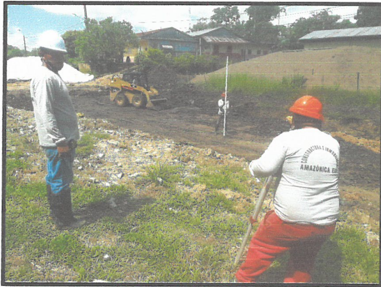
TRAZO NIVEL Y REPLANTEO

Construcción de Obras Públicas, Privadas y Alquiler de Maquinaria