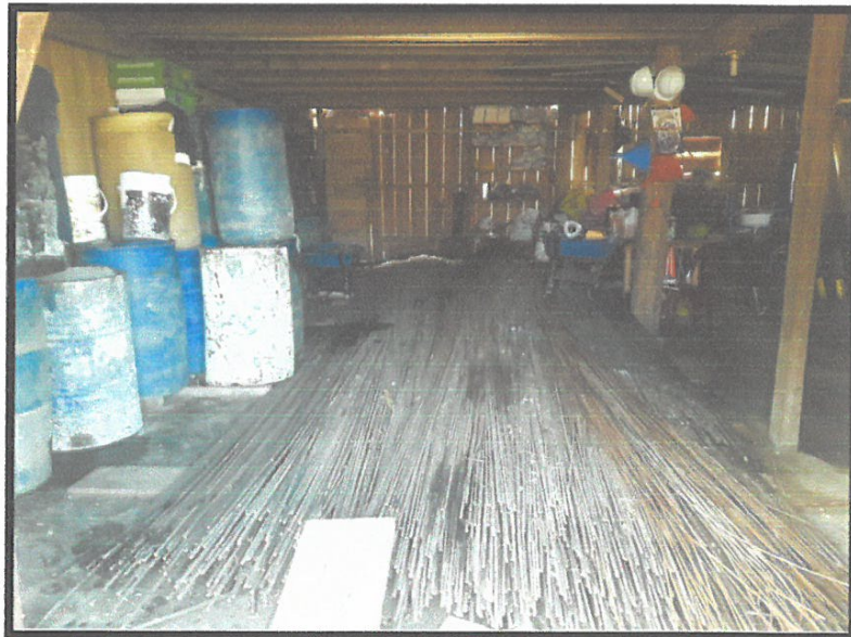
ALMACÉN DE OBRA Y VISTA DE MATERIALES