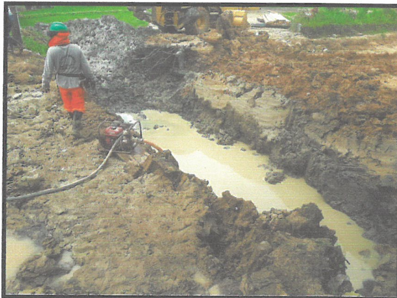
BOMBEO DE AGUA EN ZANJA C/MOTOBOMBA