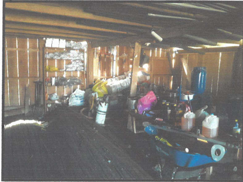
ALMACÉN DE OBRA Y VISTA DE MATERIALES

Construcción de Obras Públicas, Privadas y Alquiler de Maquinaria