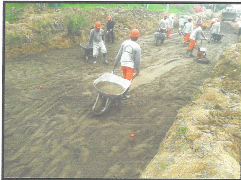
SUBRASANTE MEJORADA CON MATERIAL DE PRESTAMO 0+380