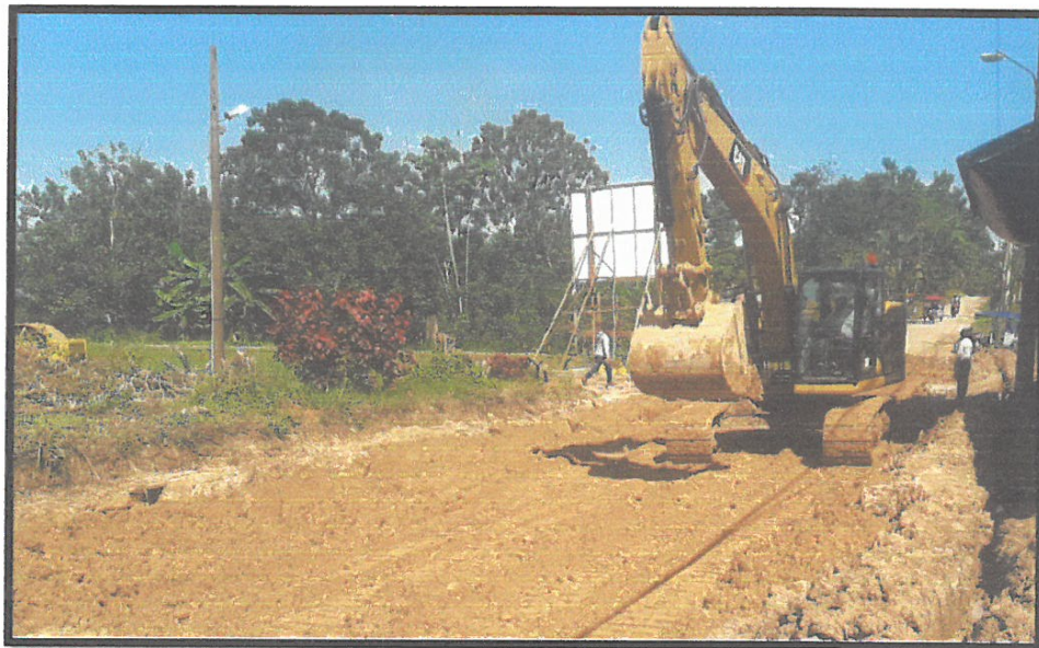
CONFORMACION DE TERRENO CON MAQUINARIA