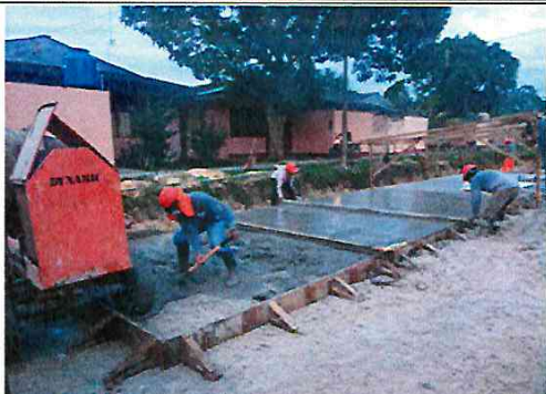
Vista: Vaceo de losa de rodadura - Ca. Libertad (Ca. Castilla/Ca. San Roman)