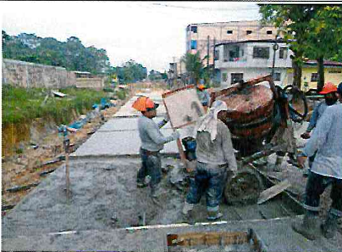
Vista: Vaceo de losa de rodadura - Ca. Libertad (Ca. Castilla/Ca. San Roman)