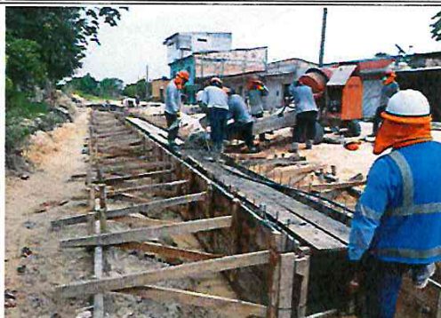
Vista: Vaceo de Muro lateral de canal en Ca. Libertad (Ca. Vargas Guerra/Ca. Sesquicentenario)