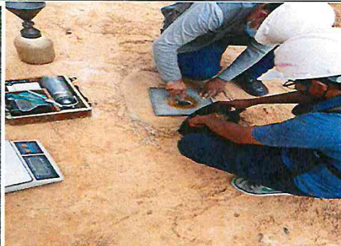
Vista: prueba de densidad de campo- Ca. Independencia I (Ca. Libertad / Ca. Atahualpa)