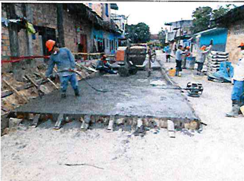
Vista: Vaceo de losa de rodadura - Ca. Independencia I (Ca. Libertad / Ca. Atahualpa)