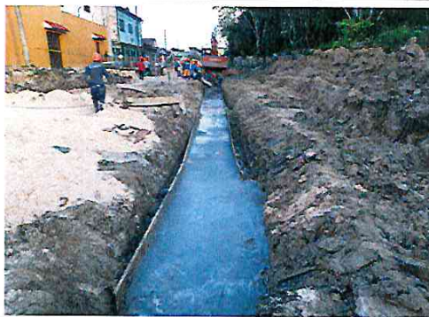
Vista: Vaceo de solado en Ca. Libertad (Ca. Vargas Guerra/Ca. Sesquicentenario)