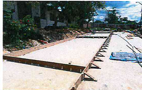
Vista: encofrado- losa de rodadura -Ca. San Roman (Ca. Libertad / Ca. Atahualpa)