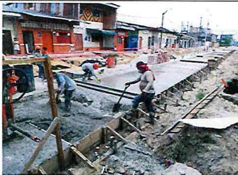
Vista: Vaceo de losa de rodadura - Ca. San Roman(Ca. Atahualpa/ Jr. Jose Galvez)