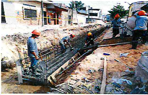
Vista: Vaceo de losa de fondo en Ca. Libertad (Ca. Vargas Guerra/Ca. Sesquicentenario)