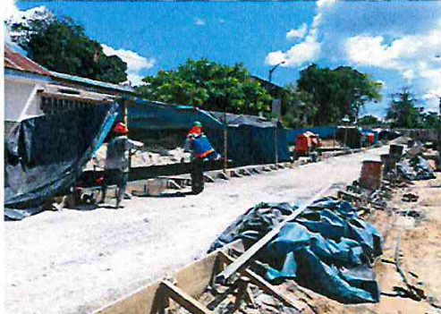
Vista: Vaceo de losa de rodadura - Ca. San Roman(Ca. Libertad/ Ca. Atahualpa)