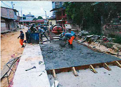
Vista: Vaceo de losa de rodadura - Pje. Independencia (Jr. Jose Galvez/Av. Del ejercito)