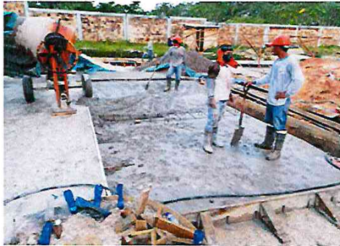
Vista: Vaceo de losa de rodadura - Ca. San Roman(Ca. Libertad/ Ca. Atahualpa)