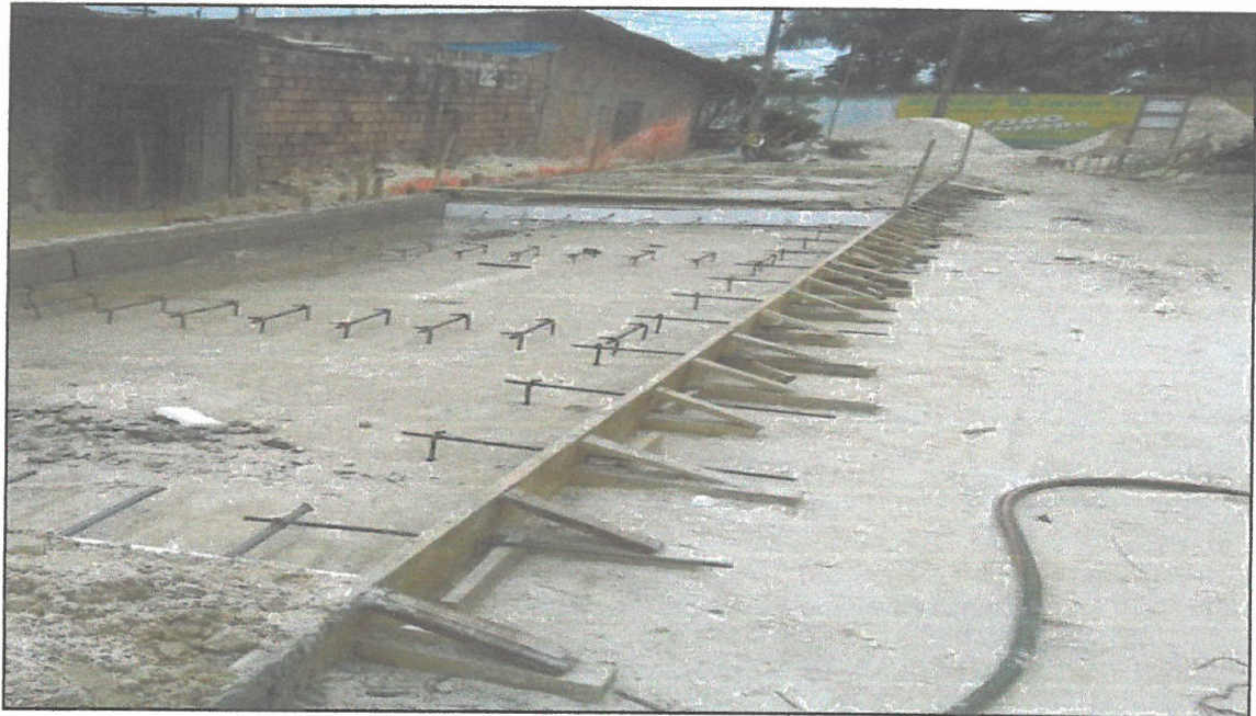
VISTA FOTOGRÁFICA N° 09

❖ ESPIGA DE FIJACIÓN CON TUBERÍA SP Ø 3/4", en juntas de dilatación