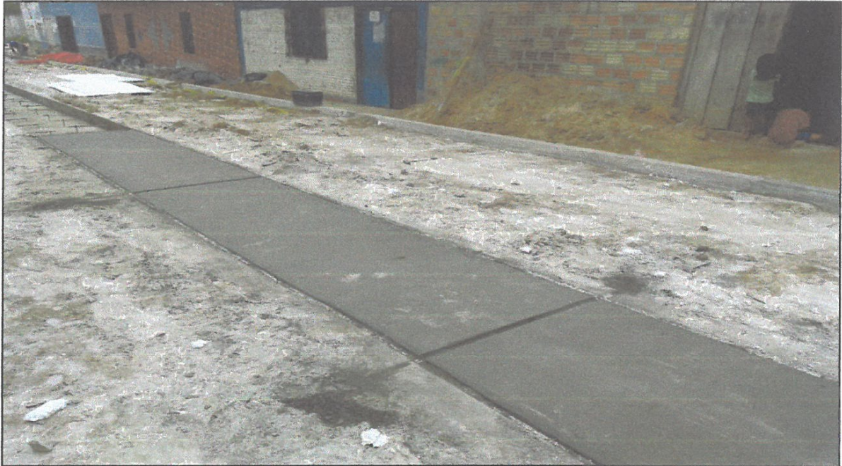
VISTA FOTOGRÁFICA N° 05