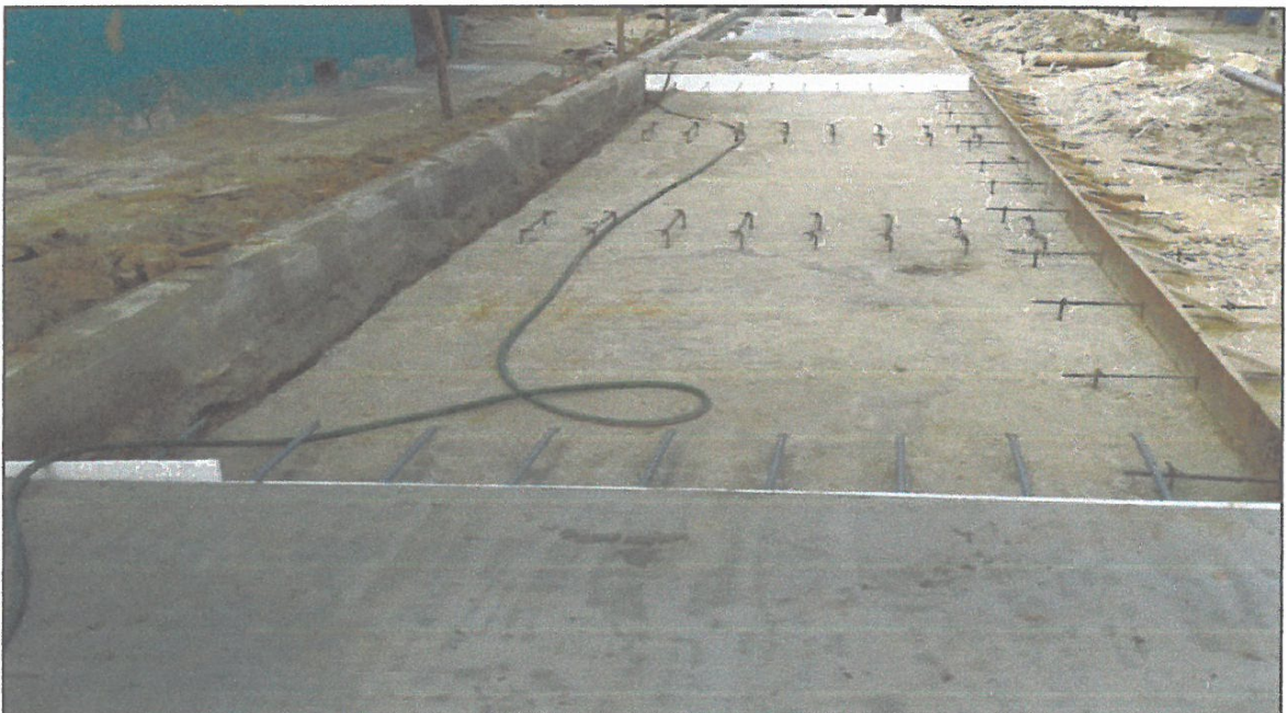
VISTA FOTOGRÁFICA N° 06

Expediente Técnico: "Mejoramiento de las Calles del AA. HH. Castañal – Pampachica, Distrito de San Juan Bautista – Maynas – Loreto"