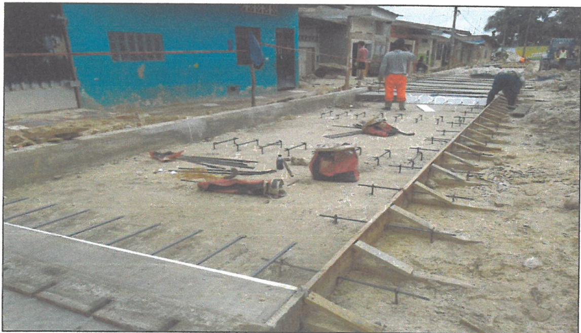
VISTA FOTOGRÁFICA N° 10

Expediente Técnico: "Mejoramiento de las Calles del AA. HH. Castañal – Pampachica, Distrito de San Juan Bautista – Maynas – Loreto"