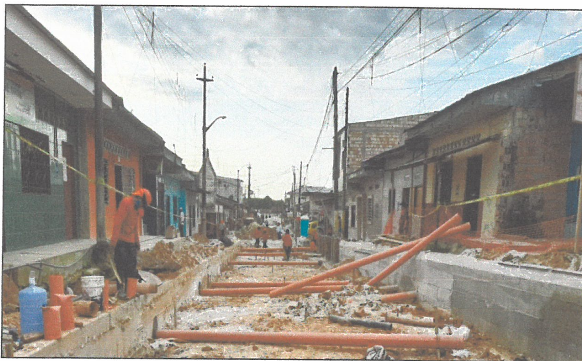
VISTA FOTOGRÁFICA N° 14: ELIMINACIÓN DE MATERIAL EXCEDENTE EN JIRÓN CASTAÑAL