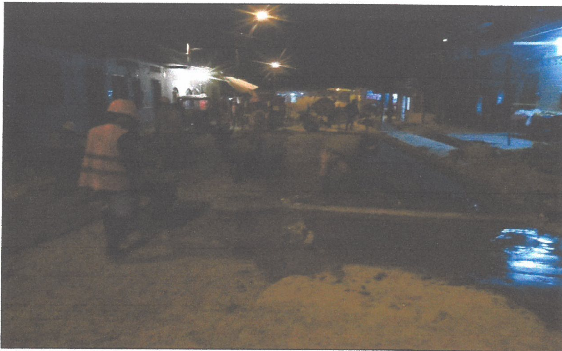
VISTA FOTOGRÁFICA N° 04: VACEADO DE SOLADO 1:10 C:A e= 4"