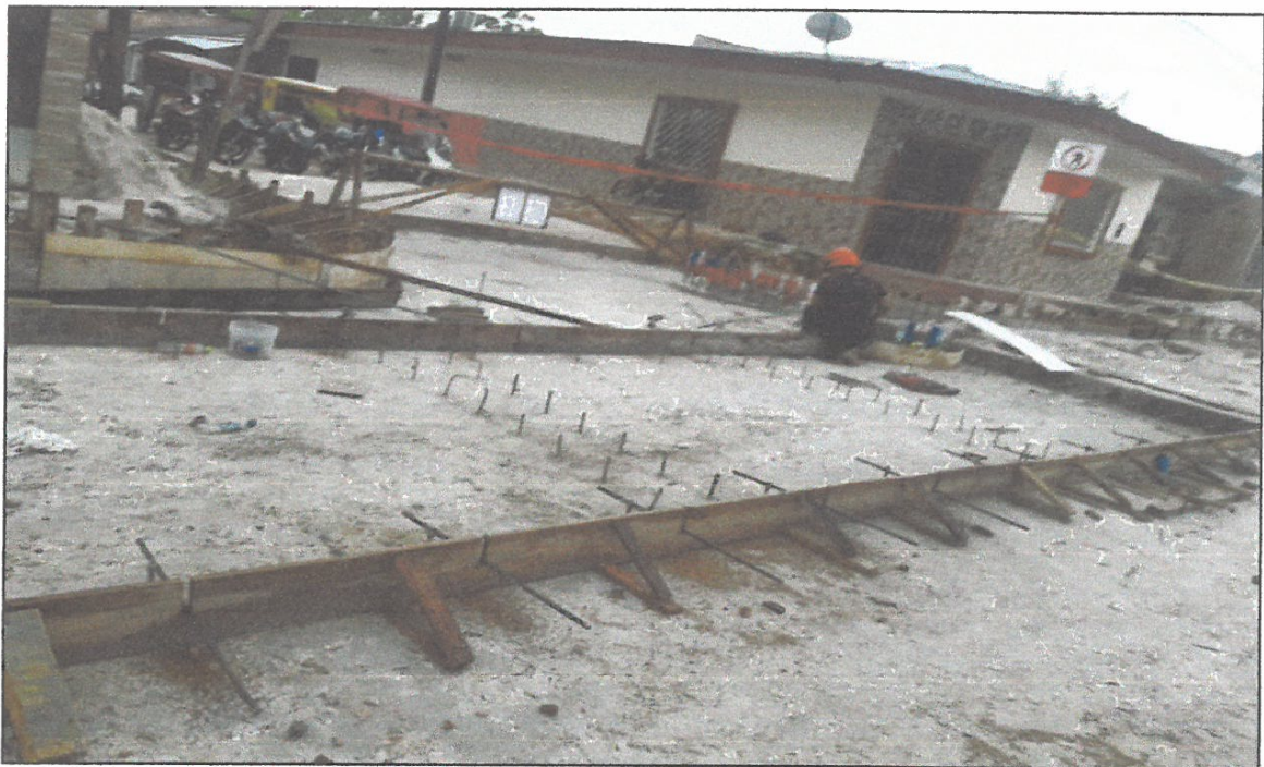
VISTA FOTOGRÁFICA N° 12: CURADO DE LOSA DE RODADURA, durante 7 días – 4 veces x día