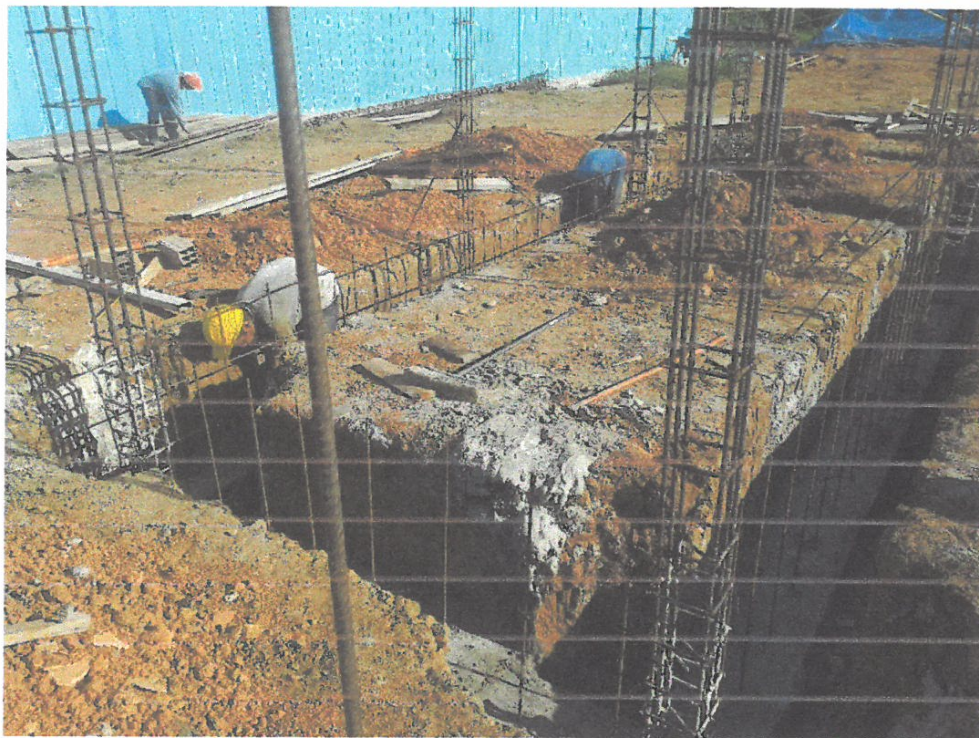
Foto N° 07: Vista de colocación de la armadura de columna y sobre cimiento del módulo "caseta de fuerza" de la obra "Mejoramiento y Equipamiento del servicio Educativo N 62200 Barrio Carabanchel - San Lorenzo, Distrito Barranca, Provincia Datem Del Marañón - Loreto"