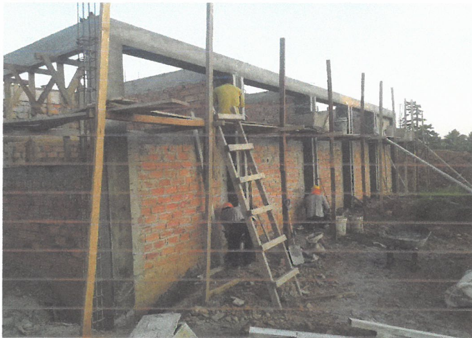
Foto N° 06: Vista de tarrajeo frotachado de muros, vigas y columnas del módulo "E" de la obra "Mejoramiento y Equipamiento del servicio Educativo N 62200 Barrio Carabanchel - San Lorenzo, Distrito Barranca, Provincia Datem Del Marañón - Loreto"