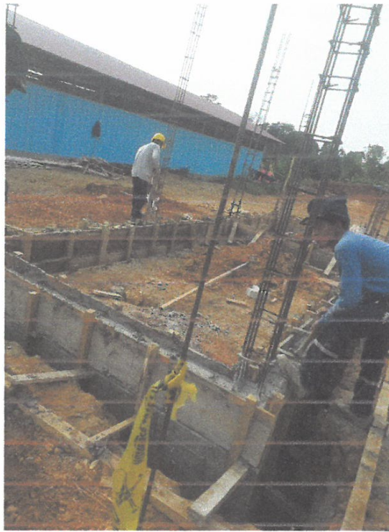
Foto N° 13: Vista del vaco de concreto en el sobre cimiento armado del cerco perimétrico de la obra "Mejoramiento y Equipamiento del servicio Educativo N 62200 Barrio Carabanchel - San Lorenzo, Distrito Barranca, Provincia Datem Del Marañón - Loreto"