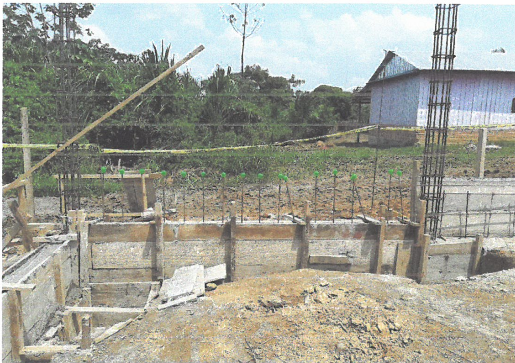
Foto N° 18: Vista del vaceo de concreto en sobre cimiento armado del cerco perimétrico de la obra "Mejoramiento y Equipamiento del servicio Educativo N 62200 Barrio Carabanchel - San Lorenzo, Distrito Barranca, Provincia Datem Del Marañón - Loreto"