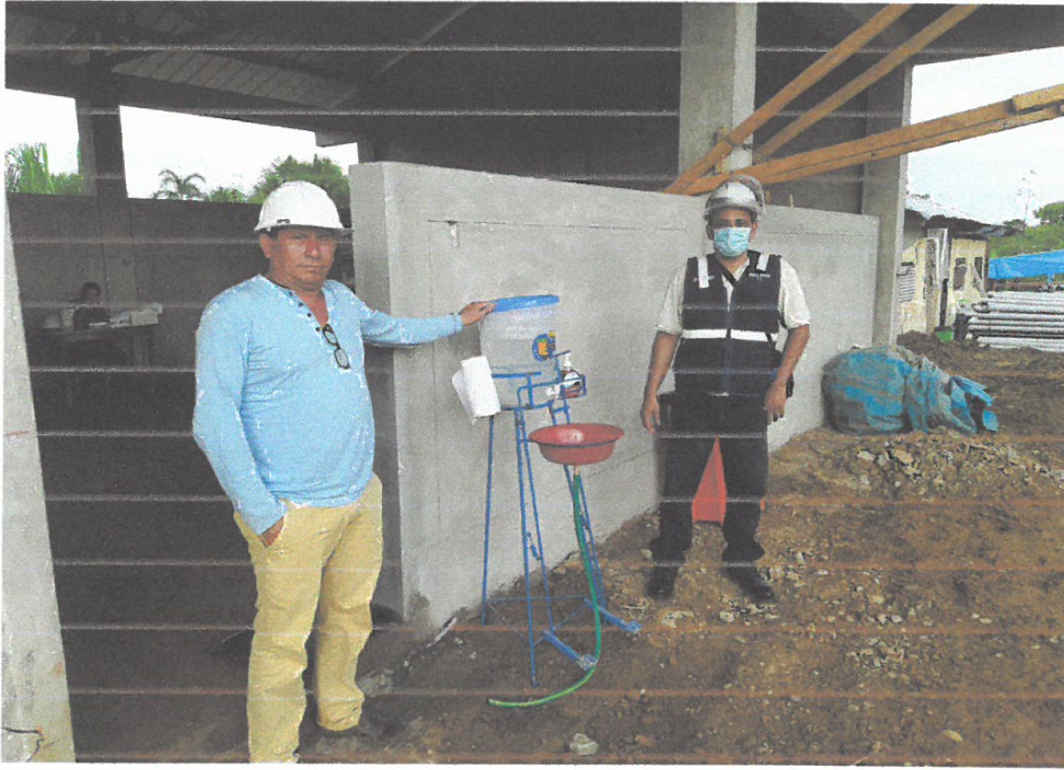
Foto N° 01: Vista del Residente y el Supervisor pasando protocolos desinfección Covid-19 “Mejoramiento y Equipamiento del servicio Educativo N 62200 Barrio Carabanchel - San Lorenzo, Distrito Barranca, Provincia Datem Del Marañón - Loreto”