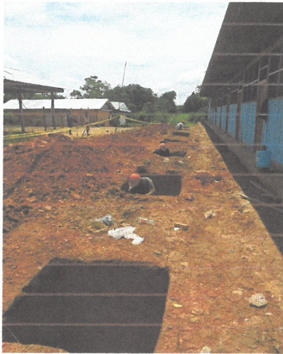
Foto N° 03: Vista de las excavaciones para zapatas del cerco perimétrico en la obra "Mejoramiento y Equipamiento del servicio Educativo N 62200 Barrio Carabanchel - San Lorenzo, Distrito Barranca, Provincia Datem Del Marañón - Loreto"