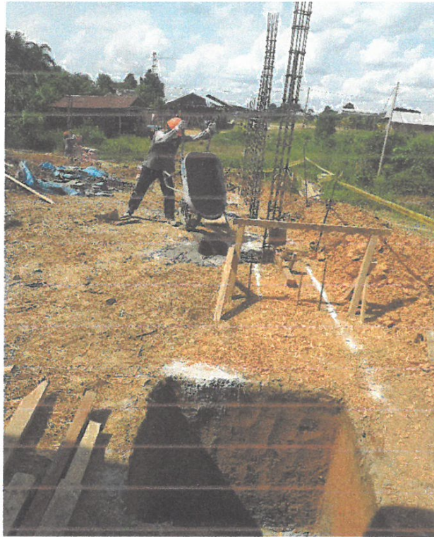
Foto N° 11: Vista del vacceo de concreto en zapatas en el cerco perimétrico en la obra "Mejoramiento y Equipamiento del servicio Educativo N 62200 Barrio Carabanchel - San Lorenzo, Distrito Barranca, Provincia Datem Del Marañón - Loreto"