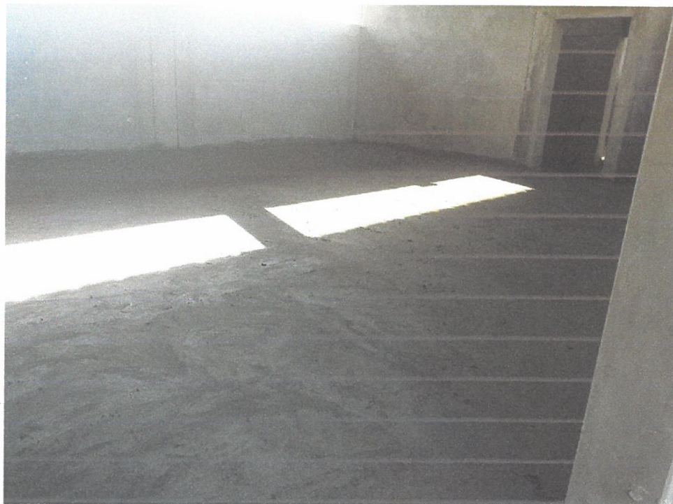
Foto N° 08: Vista del vaceo de contra piso en el módulo "C" de la obra "Mejoramiento y Equipamiento del servicio Educativo N 62200 Barrio Carabanchel - San Lorenzo, Distrito Barranca, Provincia Datem Del Marañón - Loreto"