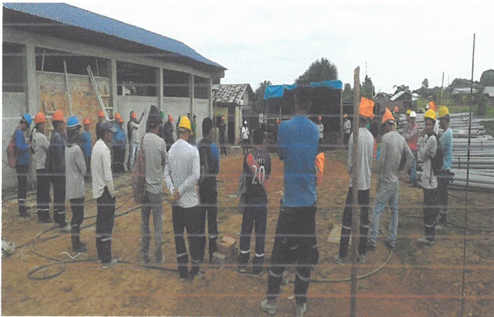
Foto N° 02: Vista de la Charla de Seguridad en el Trabajo de la obra “Mejoramiento y Equipamiento del servicio Educativo N 62200 Barrio Carabanchel - San Lorenzo, Distrito Barranca, Provincia Datem Del Marañón - Loreto”