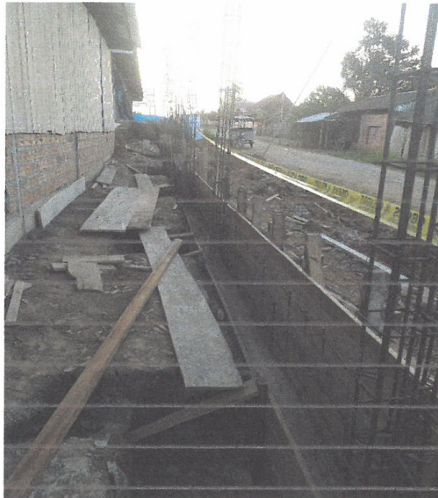
Foto N° 12: Vista del encofrado de sobre cimiento armado en el cerco perimétrico en la obra "Mejoramiento y Equipamiento del servicio Educativo N 62200 Barrio Carabanchel - San Lorenzo, Distrito Barranca, Provincia Datem Del Marañón - Loreto"