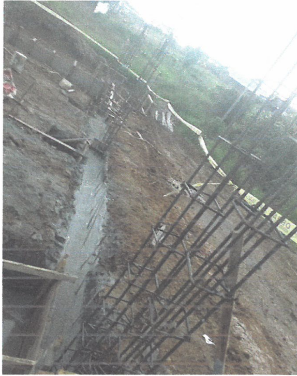
Foto N° 17: Vista del vaceo de concreto en las vigas de cimentaciones del cerco perimétrico en la obra "Mejoramiento y Equipamiento del servicio Educativo N 62200 Barrio Carabanchel - San Lorenzo, Distrito Barranca, Provincia Datem Del Marañón - Loreto"