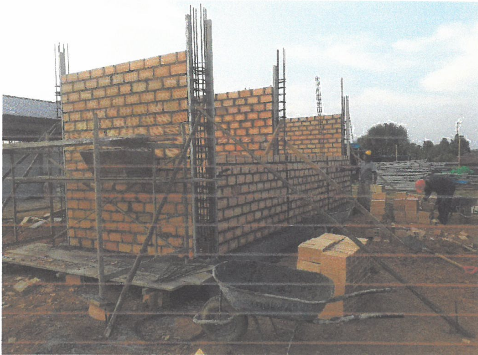
Foto N° 14: Vista del asentado de ladrillos de arcilla en el módulo de caseta de fuerza en la obra "Mejoramiento y Equipamiento del servicio Educativo N 62200 Barrio Carabanchel - San Lorenzo, Distrito Barranca, Provincia Datem Del Marañón - Loreto"