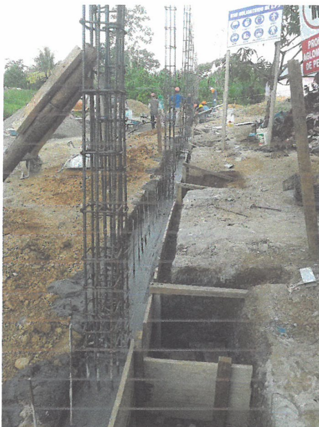
Foto N° 09: Vista del vaco de viga de cimentación en el cerco perimétrico en la obra "Mejoramiento y Equipamiento del servicio Educativo N 62200 Barrio Carabanchel - San Lorenzo, Distrito Barranca, Provincia Datem Del Marañón - Loreto"