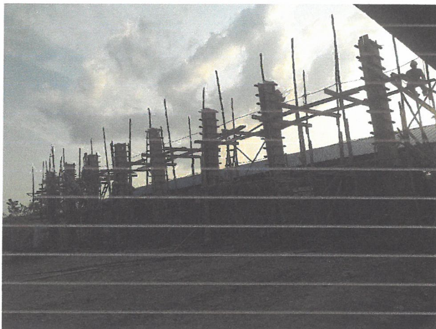
Foto N° 15: Vista del encofrado de columnas y vigas del polideportivo en la obra "Mejoramiento y Equipamiento del servicio Educativo N 62200 Barrio Carabanchel - San Lorenzo, Distrito Barranca, Provincia Datem Del Marañón - Loreto"