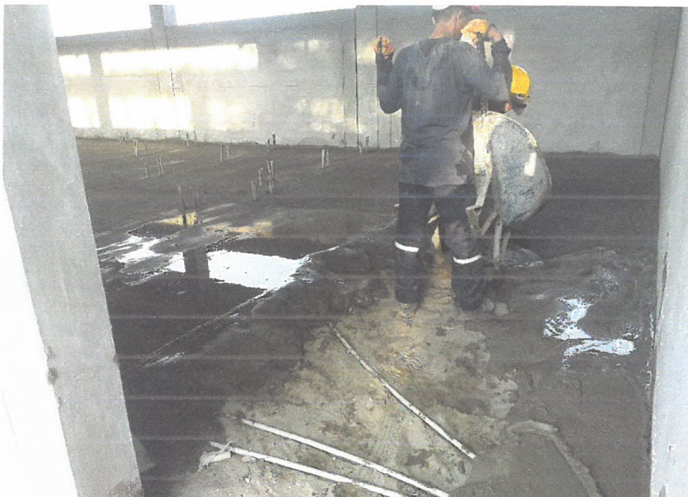
Foto N° 19: Vista del vaco de mortero en falso piso del módulo "D" en la obra "Mejoramiento y Equipamiento del servicio Educativo N 62200 Barrio Carabanchel - San Lorenzo, Distrito Barranca, Provincia Datem Del Marañón - Loreto"