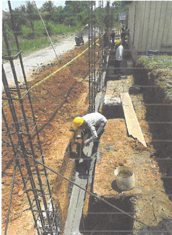
Foto N° 05: Vista del vaco de concreto en las vigas de cimentaciones del cerco perimétrico de la obra "Mejoramiento y Equipamiento del servicio Educativo N 62200 Barrio Carabanchel - San Lorenzo, Distrito Barranca, Provincia Datem Del Marañón - Loreto"