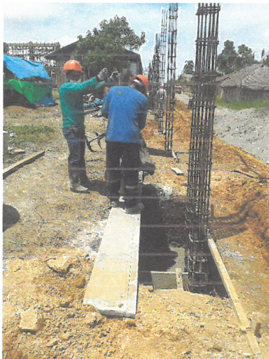
Foto N° 04: Vista del vaco de concreto en las zapatas del cerco perimétrico de la obra "Mejoramiento y Equipamiento del servicio Educativo N 62200 Barrio Carabanchel - San Lorenzo, Distrito Barranca, Provincia Datem Del Marañón - Loreto"