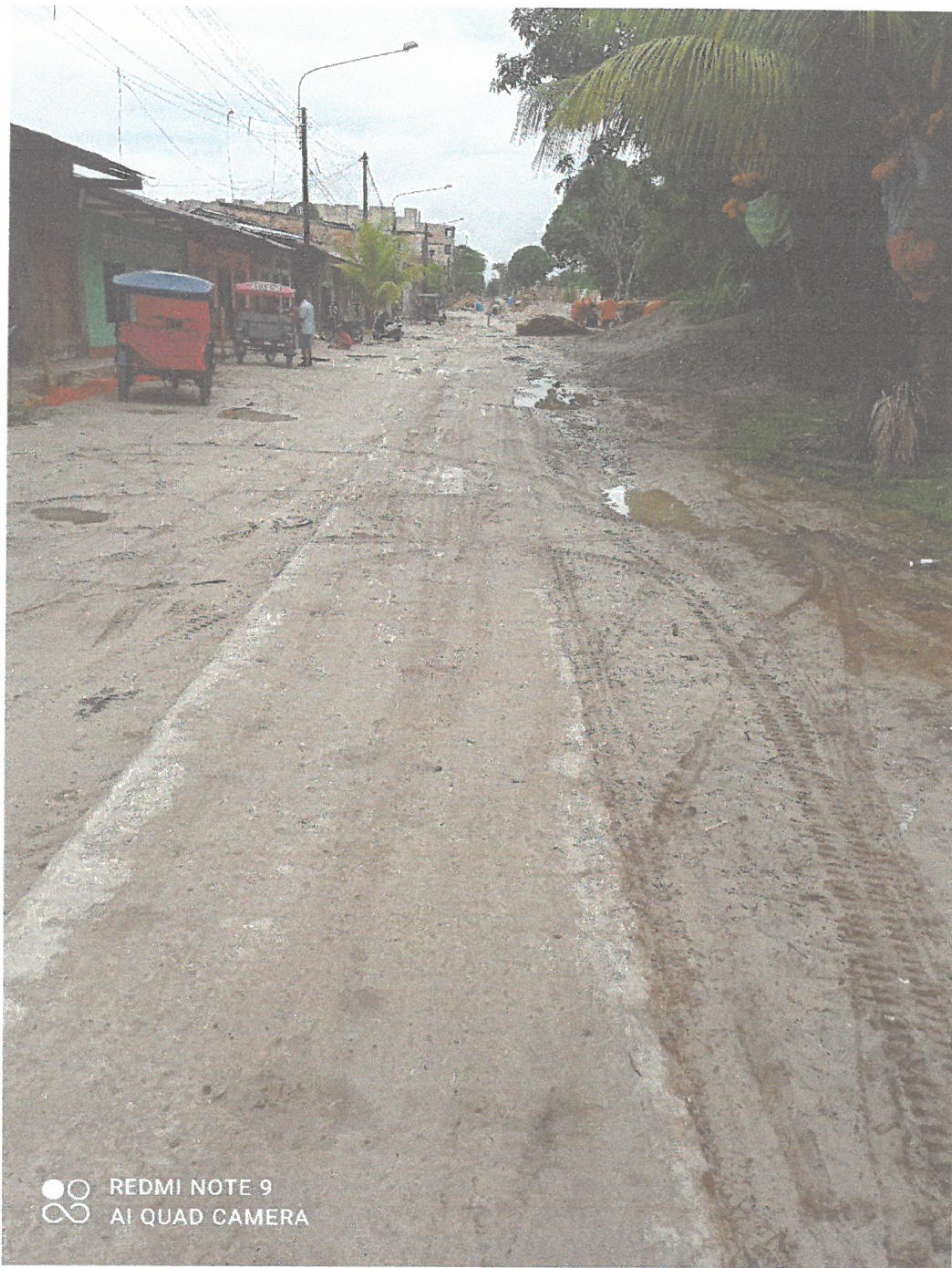
El tramo que se visualiza es de Calle Libertad en dirección hacia Pasaje Atlántida aún no inician labores, y solo existe colocación de materiales. Formaría del Plan de Monitoreo Arqueológico.