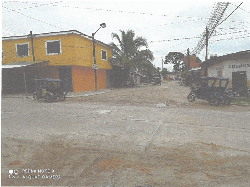
Vista de Pasaje Atlántida desde Jirón Atahualpa.