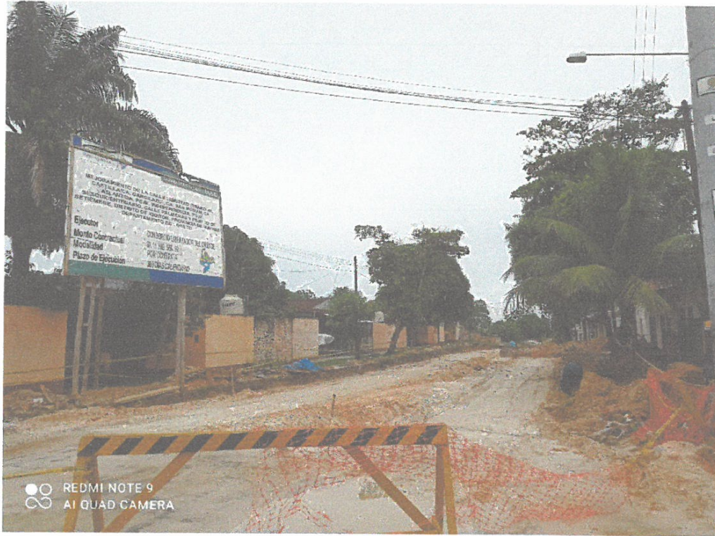
Intersección de las calles Libertad con Castilla, donde la obra prácticamente ha acabado la remoción de tierras, a la par se ha realizado zanjas en los costados y una central para agua y alcantarillado