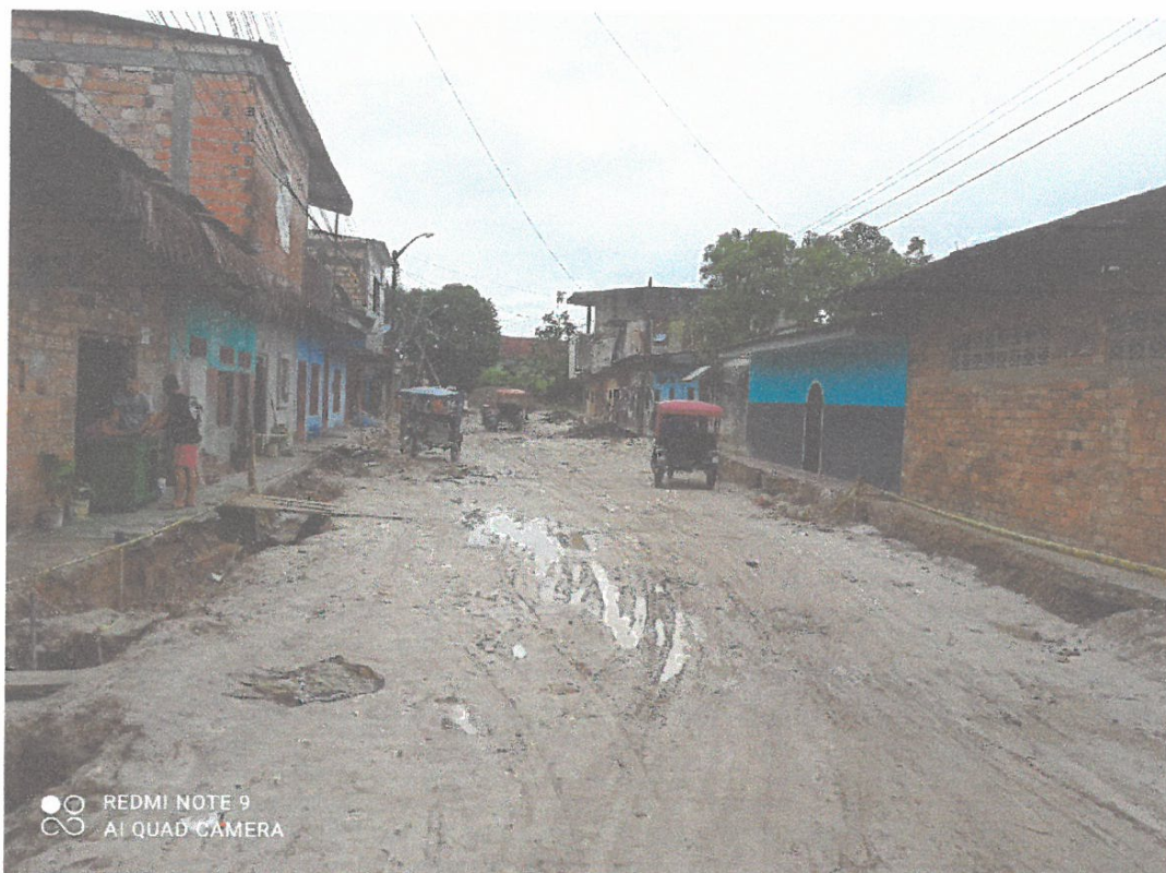
La siguiente intersección con calle Libertad es Pasaje Independencia que si presenta nivelación de terreno y trincheras laterales para agua y alcantarillado.