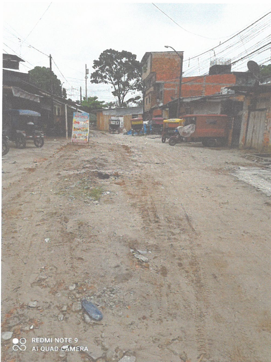
Pasaje Atlántida es otra intersección de Calle Libertad que se encuentra inmersa en la obra y que no registra intervención alguna. Actualmente sirve como puesto de almacén de la obra.