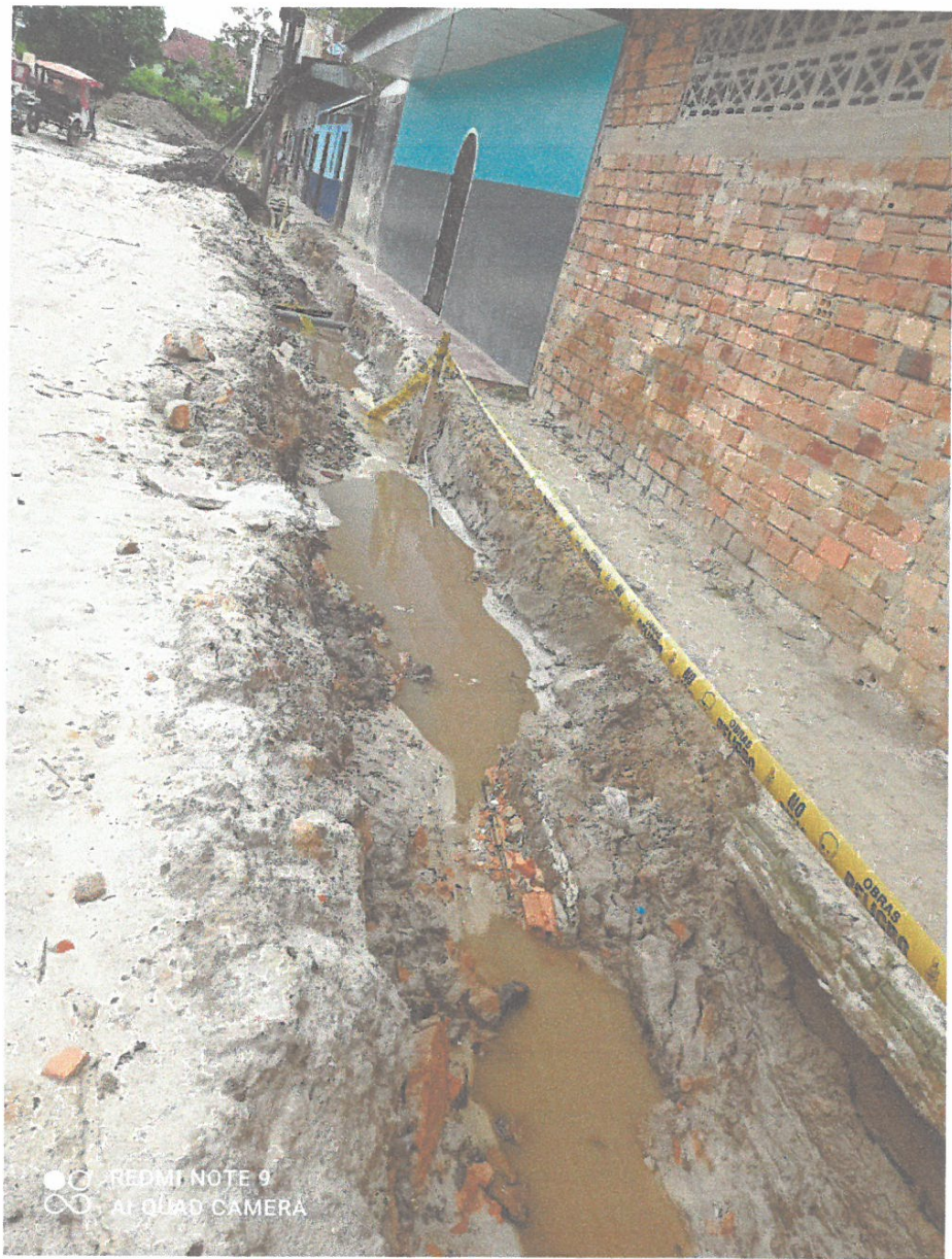
Vista de la trinchera abierta en Pasaje Independencia.