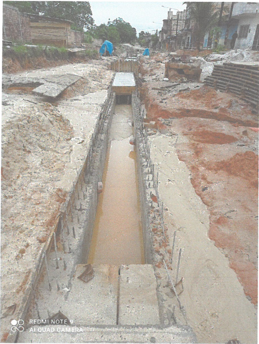
La nivelación de suelo realizado está por debajo del nivel de superficie actual, siendo la remoción de 1.20 m.