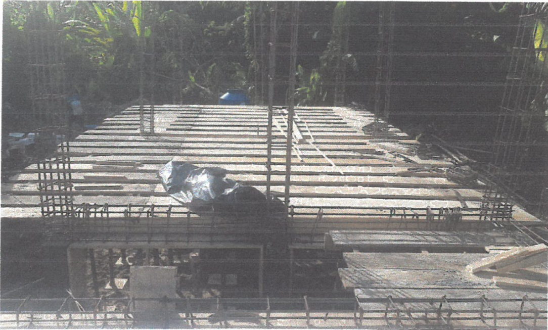
FOTO N°01: Se puede observar el trabajo de encofrado de madera para la losa aligerada.