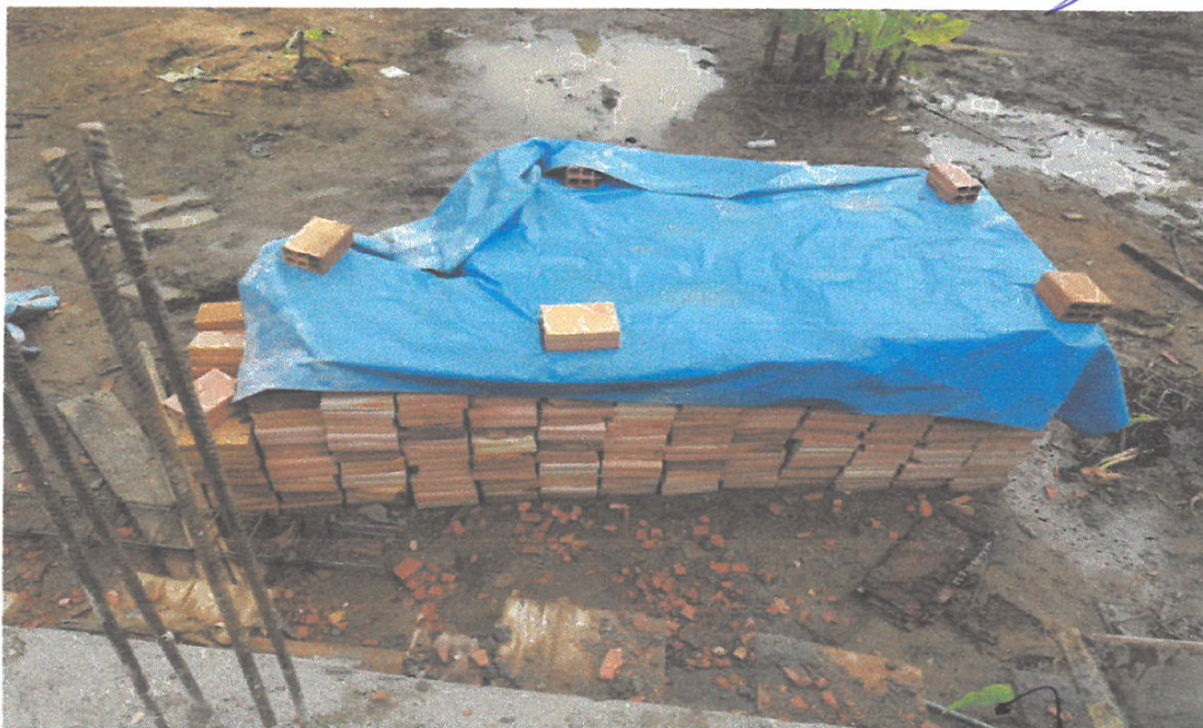
FOTO N°06: EN LA FOTO, se muestra el acopio o almacenamiento de ladrillo para la posterior construcción de los muros.