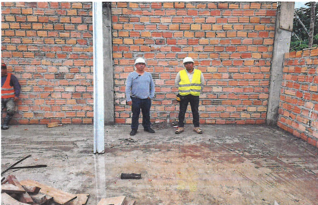
FOTO N°12: Residente de obra junto al inspector de obra verificando los trabajos realizados.