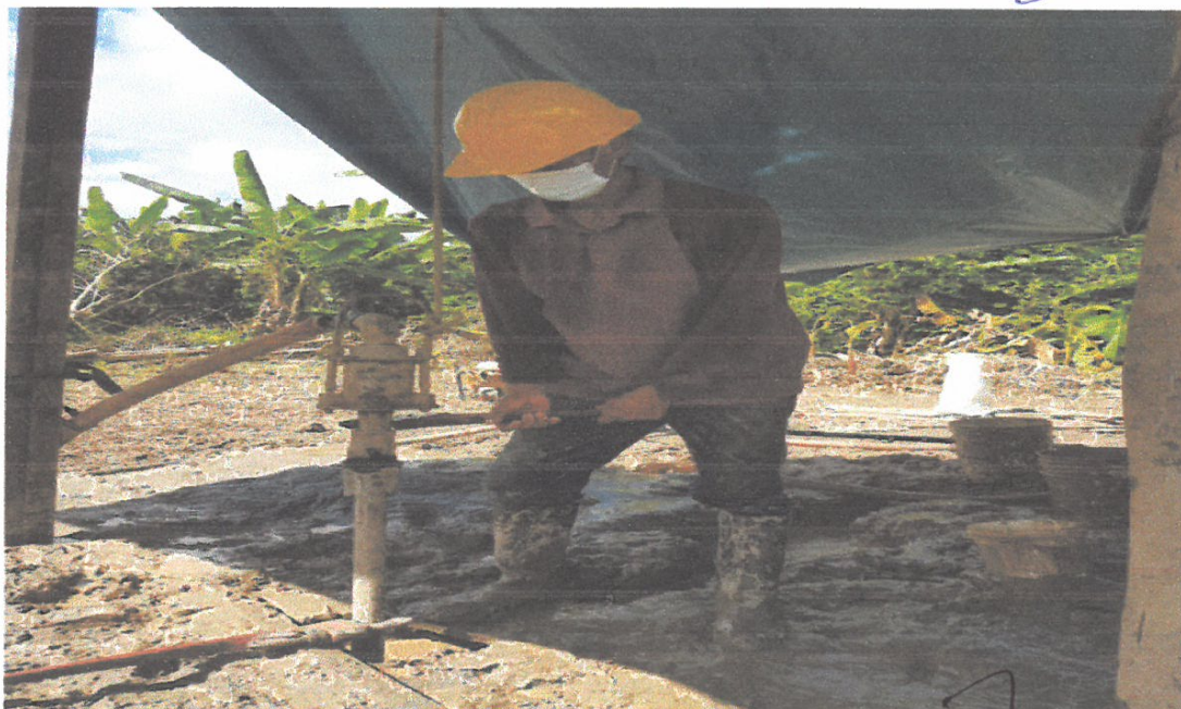
FOTO N°08: se muestra trabajos de perforación del pozo artesiano de gua para institución educativa