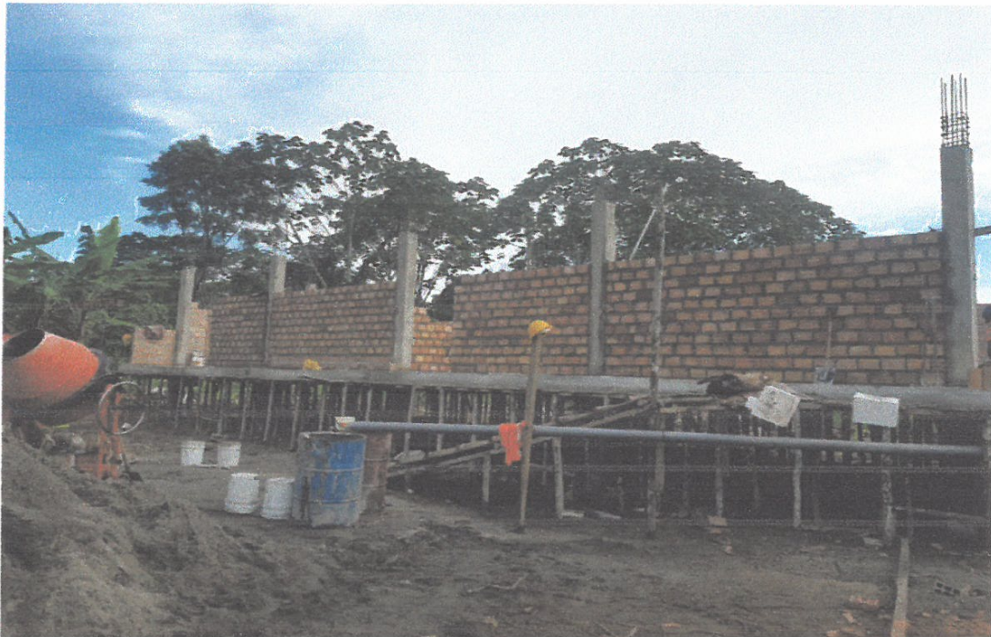
FOTO N°07: EN LA FOTO, se muestra la vista panorámica del estado de la obra