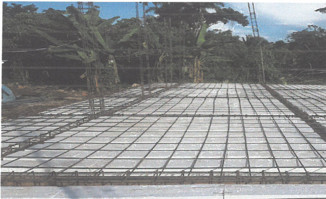
FOTO N°03: En la foto se observa la distribución de los aceros de refuerzos, las vigas de acero y el Tecnopor.

CONSORCIO ATENAS 2020 COORD. HILBERT IVAN ALVAN RIVAS APODERADO COMUN