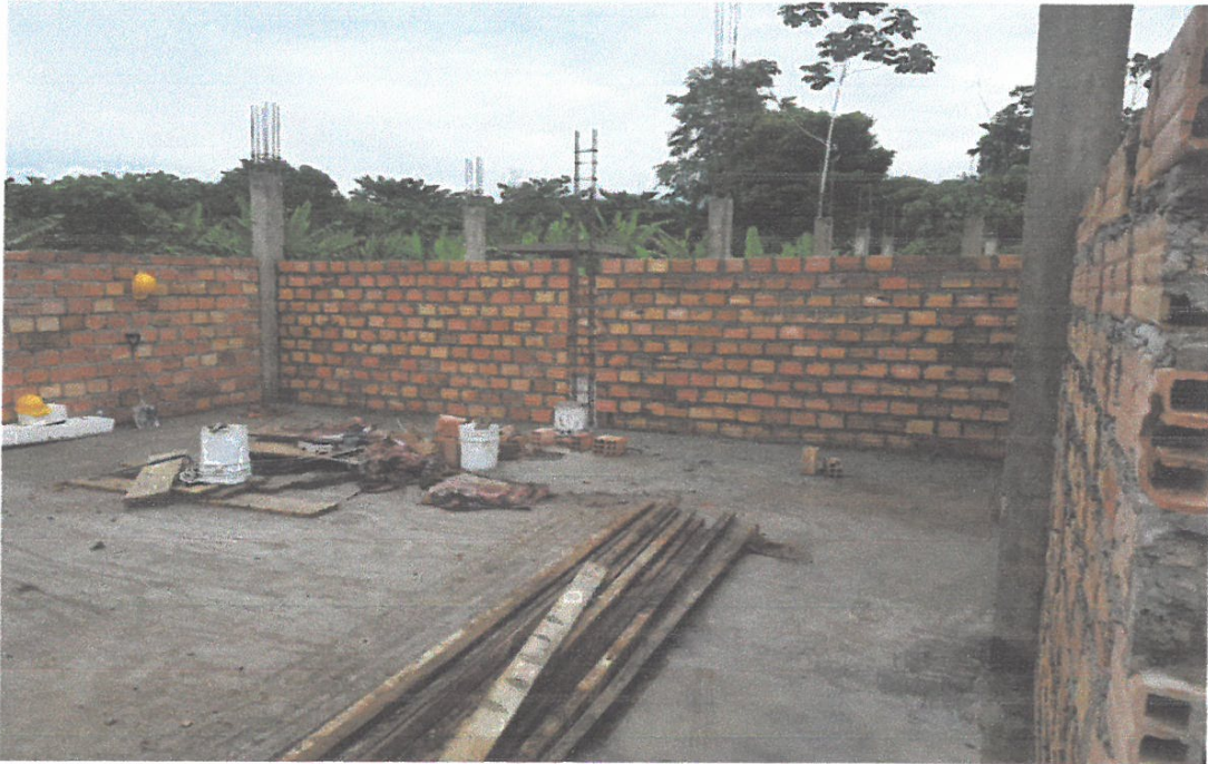
FOTO N°05: se puede observar el proceso de construcción de la losa aligerada los muros y las columnas.

CONSORCIO ATENAS 2020 LIC-ADM. HILBERT IVAN ALVAREZ RIVAS APODERADO COMUN