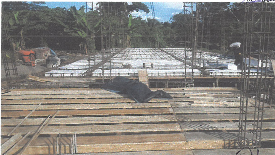
FOTO N°02: Se observa el trabajo de encofrado, colocación de Tecnopor y habilitación de acero para la losa aligerada.