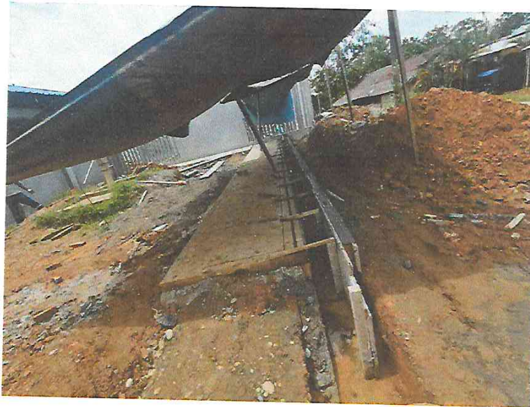
FOTO N°07: Vista del vaciado en cunetas exteriores del proyecto en la obra "Mejoramiento y Equipamiento del servicio Educativo N° 62200 Barrio Carabanchel - San Lorenzo, Distrito Barranca, Provincia Datem Del Marañón - Loreto".