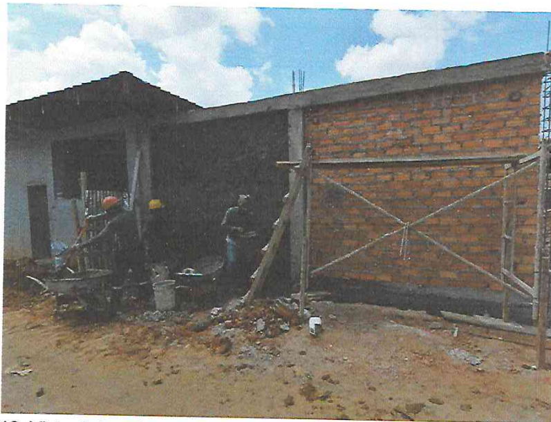
FOTO N°18: Vista de tarrajeo en muros de la obra "Mejoramiento y Equipamiento del servicio Educativo N° 62200 Barrio Carabanchel - San Lorenzo, Distrito Barranca, Provincia Datem Del Marañón - Loreto".