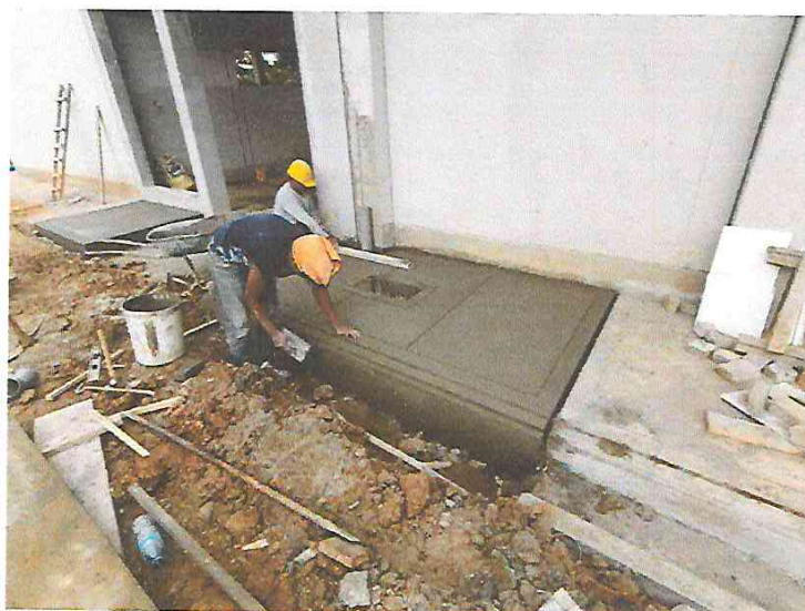
FOTO N°09: Vista retoques finales en vereda exterior al módulo principal en la obra "Mejoramiento y Equipamiento del servicio Educativo N° 62200 Barrio Carabanchel - San Lorenzo, Distrito Barranca, Provincia Datem Del Marañón - Loreto".