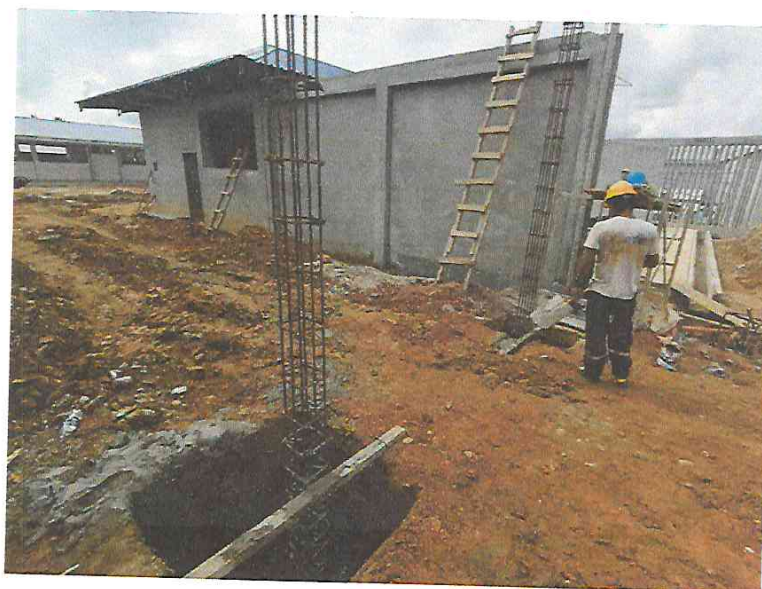
FOTO N°02: Vista de cimentaciones en la obra "Mejoramiento y Equipamiento del servicio Educativo N° 62200 Barrio Carabanchel - San Lorenzo, Distrito Barranca, Provincia Datem Del Marañón - Loreto".