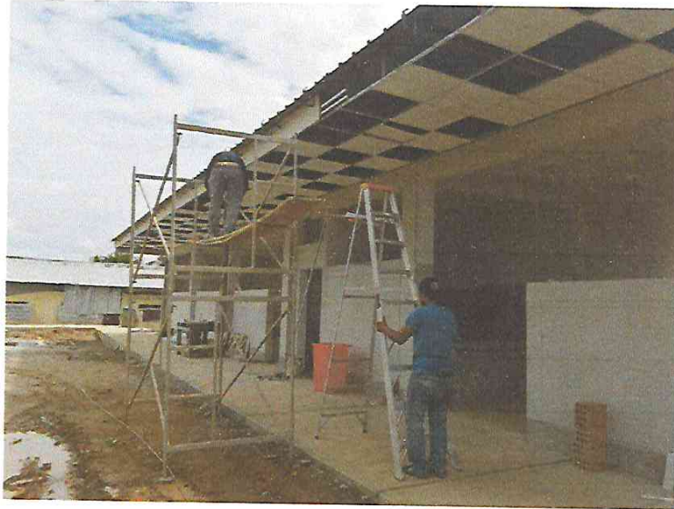
FOTO N°17: Vista del colocado de cielo raso en exterior de módulos en la obra "Mejoramiento y Equipamiento del servicio Educativo N° 62200 Barrio Carabanchel - San Lorenzo, Distrito Barranca, Provincia Datem Del Marañón - Loreto".