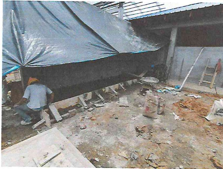
FOTO N°13: Vista de vaciado de vereda en la obra "Mejoramiento y Equipamiento del servicio Educativo N° 62200 Barrio Carabanchel - San Lorenzo, Distrito Barranca, Provincia Datem Del Marañón - Loreto".