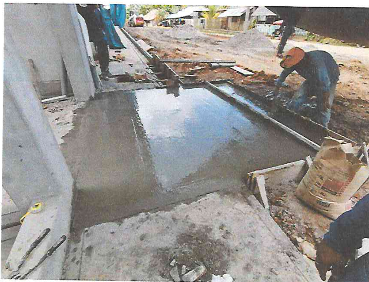
FOTO N°11: Vista de vaciado en vereda de entrada principal a la obra "Mejoramiento y Equipamiento del servicio Educativo N° 62200 Barrio Carabanchel - San Lorenzo, Distrito Barranca, Provincia Datem Del Marañón - Loreto".