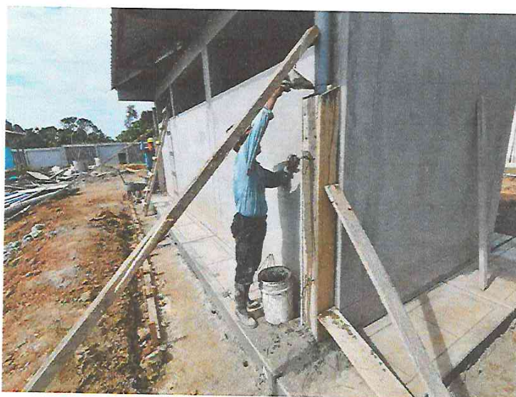
FOTO N° 20: Vista del vaciado en falsas columnas para montantes pluviales de los módulos en la obra "Mejoramiento y Equipamiento del servicio Educativo N° 62200 Barrio Carabanchel - San Lorenzo, Distrito Barranca, Provincia Datem Del Marañón - Loreto".