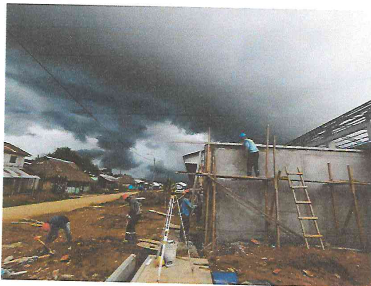
FOTO N°01: Vista de los trabajos de tarrajeo frotachado de columnas y vigas del muro perimétrico tramo 3 parte exterior de la obra "Mejoramiento y Equipamiento del Servicio Educativo N° 62200 Barrio Carabanchel - San Lorenzo, Distrito Barranca, Provincia Datem Del Marañón - Loreto".