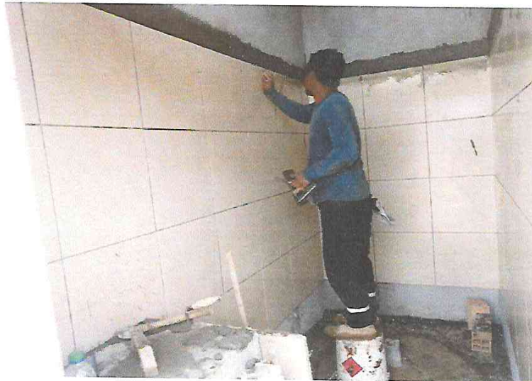
FOTO N°05: Vista de bruñado en los SS. HH en la obra "Mejoramiento y Equipamiento del servicio Educativo N° 62200 Barrio Carabanchel - San Lorenzo, Distrito Barranca, Provincia Datem Del Marañón - Loreto".