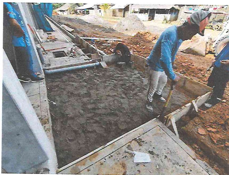
FOTO N°10: Vista del preparado de cama de arena para paño de losa exterior en la obra "Mejoramiento y Equipamiento del servicio Educativo N° 62200 Barrio Carabanchel - San Lorenzo, Distrito Barranca, Provincia Datem Del Marañón - Loreto".