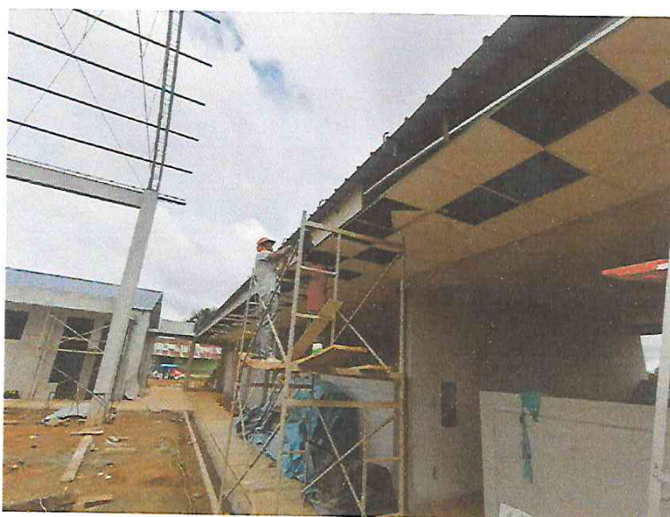
FOTO N°16: Vista del colocado de cielo raso en exterior de módulos en la obra "Mejoramiento y Equipamiento del servicio Educativo N° 62200 Barrio Carabanchel - San Lorenzo, Distrito Barranca, Provincia Datem Del Marañón - Loreto".