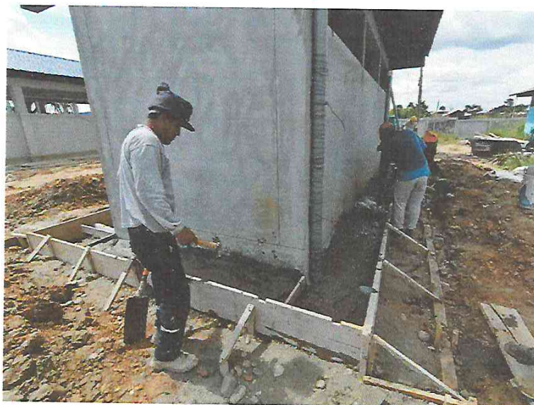
FOTO N°19: Vista del vacceo de concreto en veredas en la obra "Mejoramiento y Equipamiento del servicio Educativo N° 62200 Barrio Carabanchel - San Lorenzo, Distrito Barranca, Provincia Datem Del Marañón - Loreto".