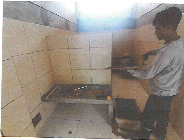
FOTO N°03: Vista de enchapado en SS. HH en la obra "Mejoramiento y Equipamiento del servicio Educativo N° 62200 Barrio Carabanchel - San Lorenzo, Distrito Barranca, Provincia Datem Del Marañón - Loreto".