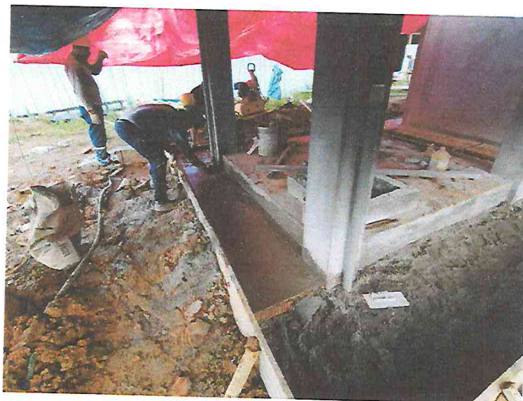
FOTO N°08: Vista del vaciado vereda del tanque elevado en la obra "Mejoramiento y Equipamiento del servicio Educativo N° 62200 Barrio Carabanchel - San Lorenzo, Distrito Barranca, Provincia Datem Del Marañón - Loreto".