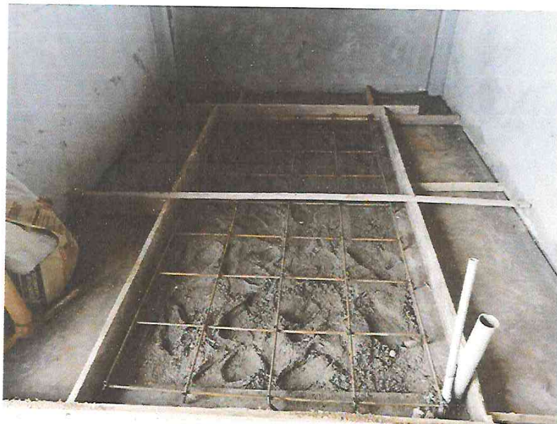
FOTO N°14: Vista de parrilla para losa en caseta de fuerza en la obra "Mejoramiento y Equipamiento del servicio Educativo N° 62200 Barrio Carabanchel - San Lorenzo, Distrito Barranca, Provincia Datem Del Marañón - Loreto".