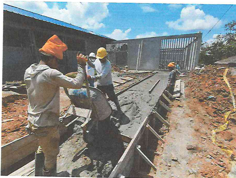
FOTO N°21: Vista del vaciado de veredas exteriores en la obra "Mejoramiento y Equipamiento del servicio Educativo N° 62200 Barrio Carabanchel - San Lorenzo, Distrito Barranca, Provincia Datem Del Marañón - Loreto".