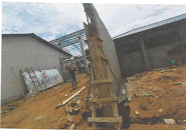
FOTO N°12: Vista de encofrado de columna en muro de ingreso principal en la obra "Mejoramiento y Equipamiento del servicio Educativo N° 62200 Barrio Carabanchel - San Lorenzo, Distrito Barranca, Provincia Datem Del Marañón - Loreto".