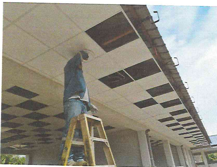
FOTO N°22: Vista del colocado de luminarias en exterior de módulos en la obra "Mejoramiento y Equipamiento del servicio Educativo N° 62200 Barrio Carabanchel - San Lorenzo, Distrito Barranca, Provincia Datem Del Marañón - Loreto".