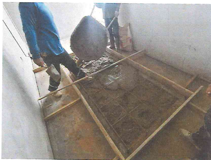
FOTO N°15: Vista del vaciado losa en caseta de fuerza en la obra "Mejoramiento y Equipamiento del servicio Educativo N° 62200 Barrio Carabanchel - San Lorenzo, Distrito Barranca, Provincia Datem Del Marañón - Loreto".